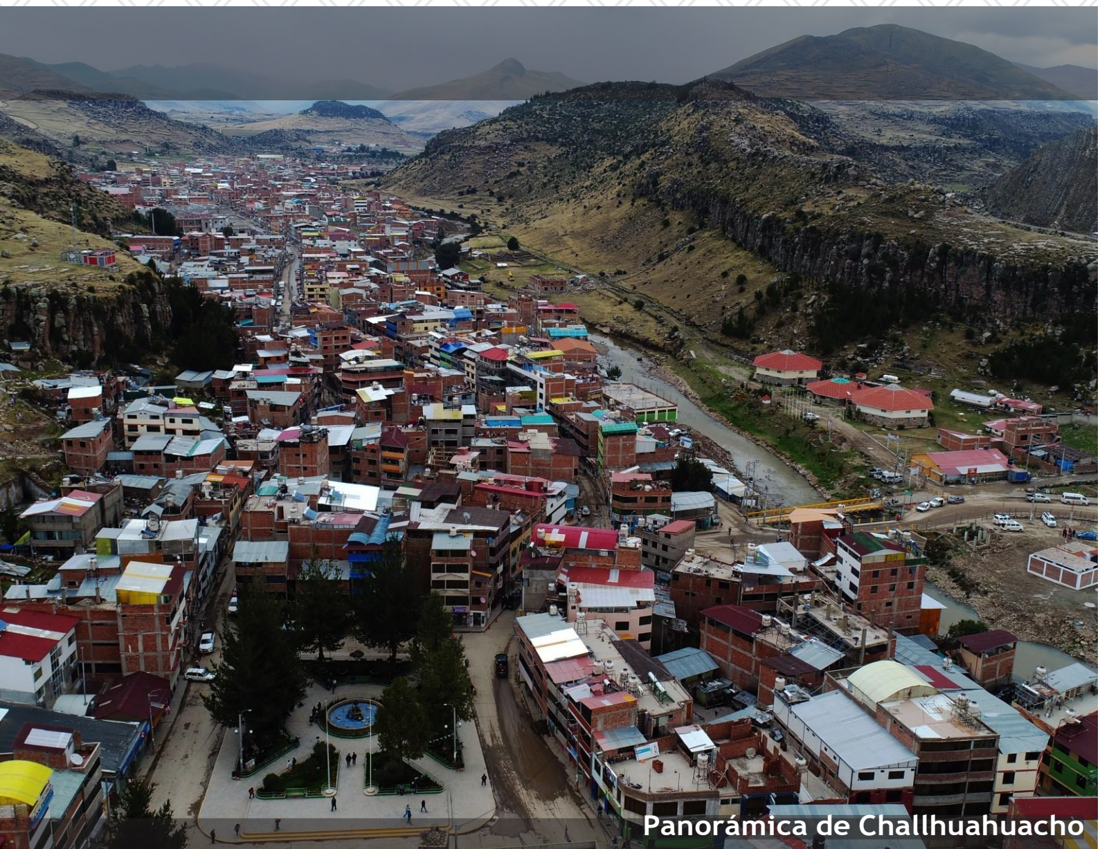
Panorámica de Challhuahuacho

Gestión 2019 - 2022 Mg. Porfirio Gutiérrez Paniura Alcalde